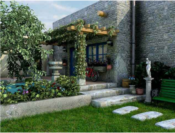
Copyright Gregor Knechtel and Alex Sander. GNU Free Documentation License. Low Resolution